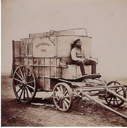
Resim 1.1 :Roger Fenton

Basında yayımlanan ilk haber resimlerinden biri, arabasında giden kraliçeye genç bir adamın silah çekmesi olayının görüntülediği resimdir. Fotoğrafın basın dünyasına girişi