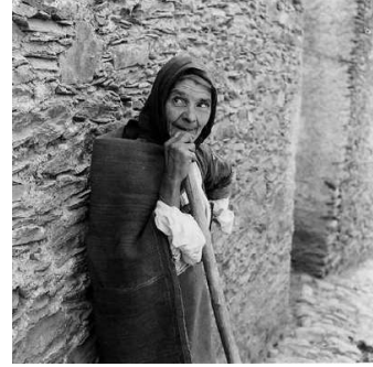
Foto-muhabirliğine başlangıcı; göç yolu ile geldiği Berlin’de edindiği ilk Leica’sı ile olmuştur. Bu sayede politika ve edebiyatı bir araya getirebilme düşünüyü pekiştirmiştir. Bu amaçla, Berlin’de kendisi gibi fotoğrafçı ve göçmen olan sevgilisi Gerda Taro ile “Dephot” Fotoğraf ajansına girerler. İlk kez yerel haberlerde fotoğraf çalışmalarını sürdüren Capa, karanlık oda asistanı olarak ajans çalışmalarına katılır. İlk uluslararası haber başarısını Kopenhag’da Troçki’nin katıldığı bir toplantıda çektiği fotoğraflarının İngiltere’de yayımlanması ve dikkat çekmesiyle elde eder.

Yaşadığı dönem boyunca bizzat katıldığı ve fotoğrafladığı beş büyük savaş ve elli küsur çatışma, Robert Capa'ya Picture Post dergisinin nitelendirmesi ile “Dünyanın en büyük savaş Fotoğrafçısı” unvanını hak ettiğini gösterir. Gerçek ismiyle Andre Freidmann 22 Haziran 1913 yılında Budapeşte’de dünyaya geldi. Gençlik yıllarını da, “Munka (İş)” dergisinde takip ettiği Lewis Hine ve Jacob Riis gibi “19.yy Toplumsal Gerçekçi” fotoğrafçıların fotoğrafları onu fotoğraf ile tanıştırdı. 1931 yılında Macaristan’da bir dönem komünist partisi üyesi olduğu ve Amiral Miklós Horthy anti-semitist politikalarına direnen işçi hareketi içinde yer aldığı için soruşturmaya uğrayan Capa, ülkesini terk etmek zorunda kalır.