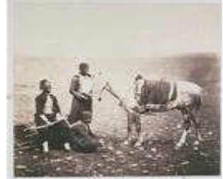
R.Fenton: Türk askerler

Birçoğu fotoğraflarını kitap ya da plaket biçiminde yayımlayabilmiştir. Çünkü kopya tekniği (gravürcüler tarafından yapılan fotoğraf kopyaları) gazeteler için çok pahalı ve oldukça kullanışsızdır.